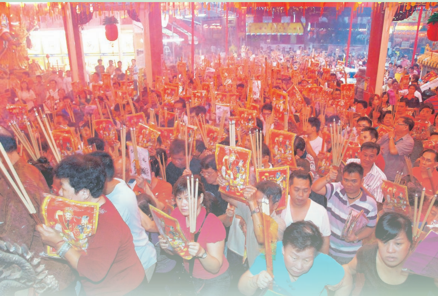
大年除夕，庙里人山人海，挤满了参加“接财神”仪式的善信