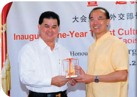
新加坡道教学院院长陈添来BBM先生(左), 大会贵宾、外交部长杨荣文先生(右)