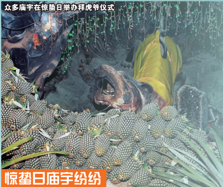
众多庙宇在惊蛰日举办拜虎爷仪式