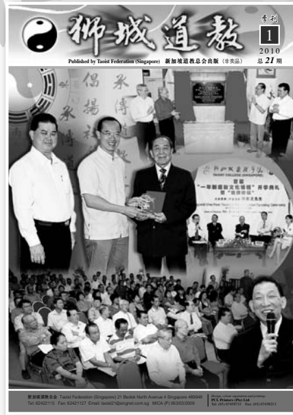
封面说明 新加坡道教学院 为首届“一年制” 道教文化课程“开 道坛”暨“开道教 坛”。