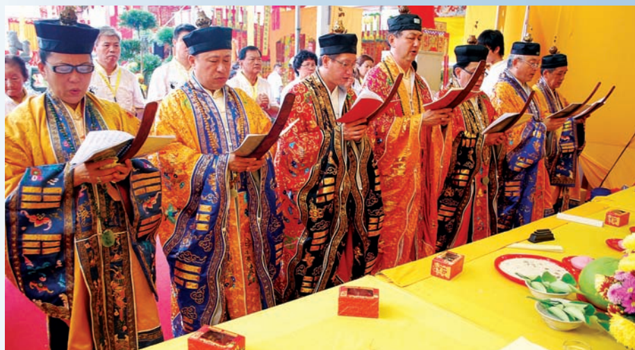
新加坡灵宝皇坛在马来西亚北海斗母宫举行海南道场