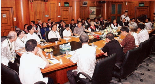
2007年第一次世界城隍庙交流大会之情景