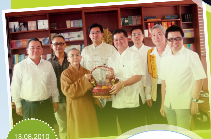
13.08.2010 国际佛光会 新加坡协会