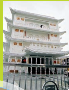
06.09.2010 新加坡犹太人 福利协会