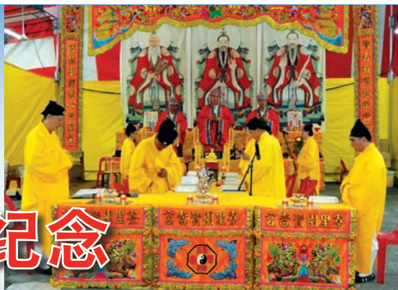
大三清(先天斛食济炼幽科)仪式。