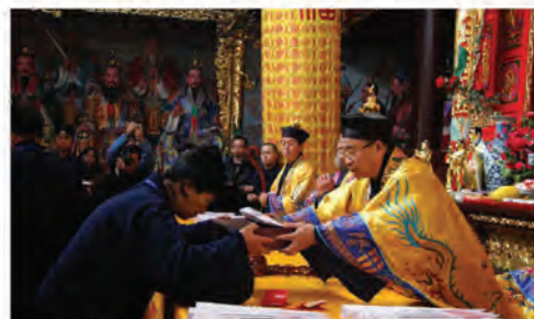
传度科仪由中国江西龙虎山嗣汉天师府高功道长主持

龙虎山嗣汉天师府乃道教祖庭，正一道教圣地。传度大典，将使更多有心向道之人步入道教正途。受传度者将被授予中国江西省鹰潭市龙虎山嗣汉天师府度牒。