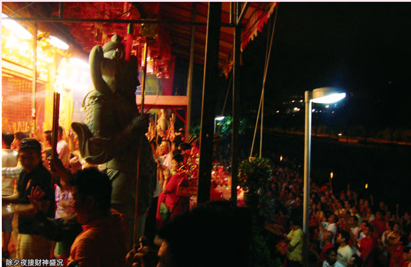
除夕夜接财神盛况